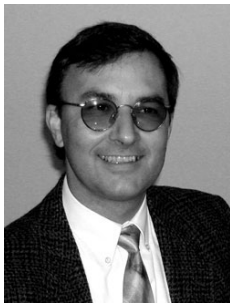
Lorenzo Bassi sindaco

Quale responsabile dell'Amministrazione, consacra giornalmente 2 ore alla gestione, al controllo e al coordinamento delle molteplici attività legate al comune per il miglior funzionamento dello stesso, naturalmente con la collaborazione dei dipendenti guidati dal segretario. Per l'edilizia privata, grazie alla legge cantonale che delega all'Ufficio Tecnico buona parte delle decisioni, svolge una supervisione di tutte le richieste private inoltrate, prima di richiedere il preavviso municipale. Mantiene la disponibilità ad incontrare settimanalmente la popolazione previo appuntamento.