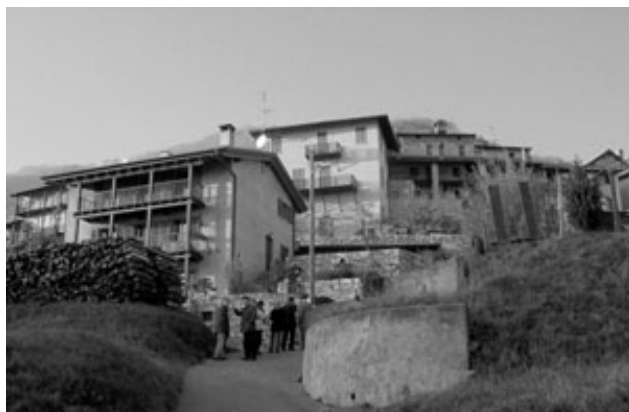
Monte visto dalla strada che porta alla ex casa comunale

Si è trattato di un'occasione importante per valutare assieme l'attività della sezione e per darle un nuovo regolamento di organizzazione, nel quale si sottolinea la grande importanza dell'attività promossa dai giovani e dalle amiche PPD.