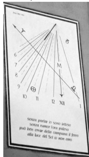
Meridiana a Casima

Il Legislativo ha pure adottato la variante di compensazione (fr. 12'077.--) per la diminuzione dell'area agricola a seguito dell'attribuzione a zona edificabile della Zona di completamento del nucleo di Casima.