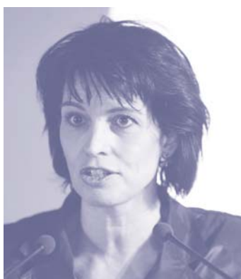
Doris Leuthard, consigliera federale

Per garantire la sua permanenza in Consiglio Federale, confermando l'apprezzamento espresso dalla maggioranza degli svizzeri, e per dar più forza ai nostri ideali che sono la famiglia, i giovani, l'ambiente e la sicurezza, sosteniamo il PPD!